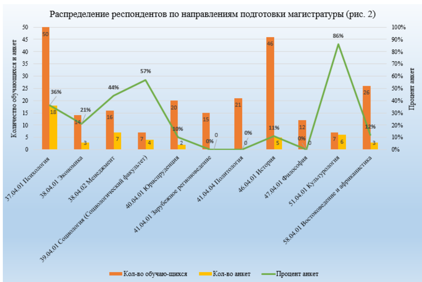
Табл. 4 Распределение респондентов магистратуры с разбивкой по программам (профилям), формам обучения и курсам

регионоведение, 41.04.04 Политология, 47.04.01 Философия) обучающиеся не приняли участие в прохождении опроса (рис. 2).