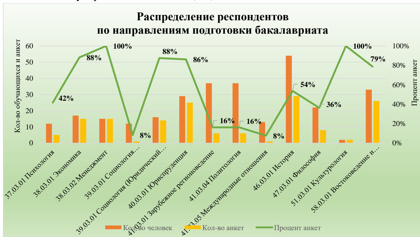
Табл. 2 Распределение респондентов бакалавриата по программам

Самые высокие показатели участия обучающихся отмечены по направлениям подготовки 38.03.02 Менеджмент и 51.03.01 Культурология (100% от численности студентов направления подготовки). Самая низкая активность студентов отмечена по направлению подготовки 39.03.01 Социология (Социологический факультет) и 41.03.05 Международные отношения (8%).