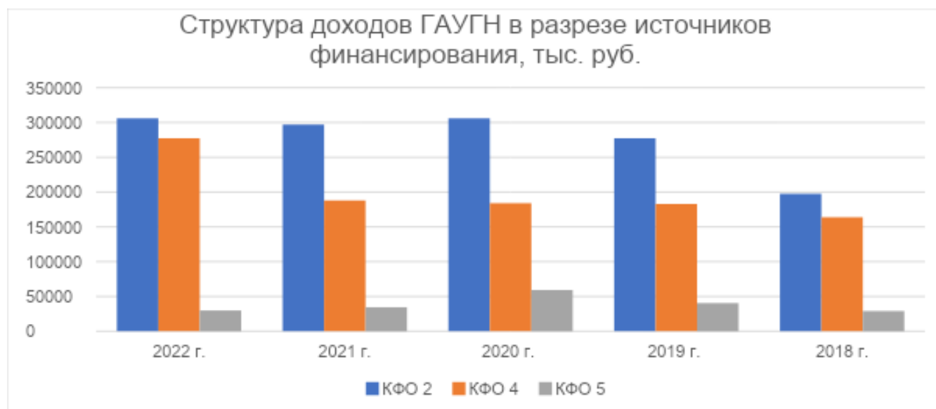
Рисунок 1 Динамика и структура доходов ГАУГН в разрезе источников финансирования, тыс. руб..

Динамика и структура доходов ФГБОУ ВО ГАУГН за период 2018 – 2022 гг. представлена на рис.1